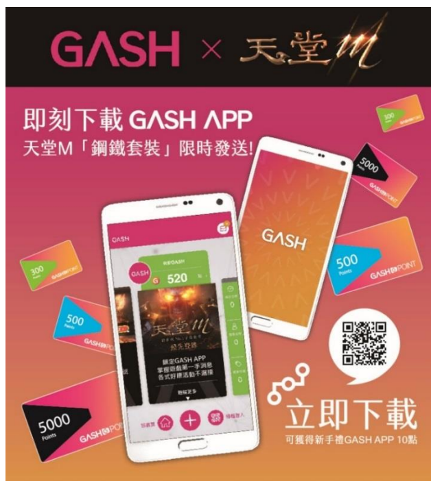
圖二：樂點 GASH 加碼推出預先登錄下載 GASH APP 送「獨家鋼鐵套裝」活動。

「GASH 爆樂巡迴車」延續《天堂 M》霸氣王者風範的形象打造出黑色外裝車體，活動現場除了延續預先登錄下載 GASH APP 送「獨家鋼鐵套裝」活動外，凡新手下載 GASH APP 都可立即獲得 GASH10 點回饋。若完成指定任務，再憑 GASH APP 內 TICKET 電子票券功能，至合作攤位免費兌換飲料或餐點。此外，玩家現場與「GASH 爆樂巡迴車」拍照並打卡上傳官方粉絲團，更有機會抽中 GASH 500 點，有吃有玩又有拿，好康不間斷，要讓民眾滿載而歸。