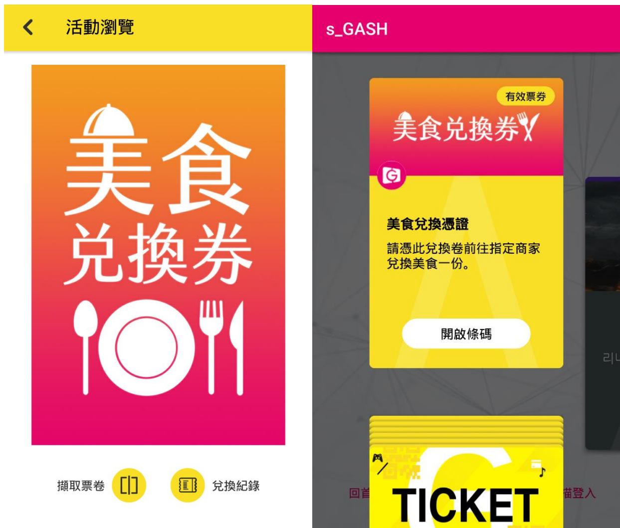
圖四：完成 Show Girl 指定任務，再憑 GASH APP 內 TICKET 電子票券功能，至合作攤位領取雞排等在地美食。