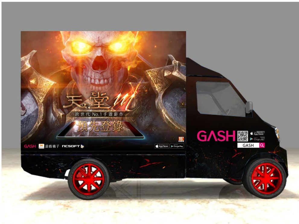
圖一：「GASH 爆樂巡迴車」延續《天堂 M》王者風範的形象打造出黑色外裝車體，霸氣登場。

《天堂 M》中文版繼預先登錄首日破 54 萬，一周破 80 萬後再創捷報，10 月 26 日中午官方網站搶先開放「預先創角」活動後，再掀一波熱潮，截至 10 月 31 日止，登錄人數突破 150 萬大關，營運夥伴樂點 GASH 除了加碼送「獨家鋼鐵套裝」，再推出以《天堂 M》為主視覺打造「GASH 爆樂巡迴車」活動，自 11 月 4 日起，每個週末陸續出現在台灣各大夜市與景點，首站選在高雄瑞豐夜市及高雄草衙道登場，是喜愛《天堂 M》的玩家們不容錯過的全台最新打卡熱點！